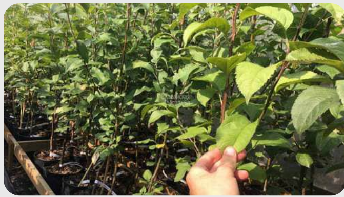
GIZELLA 6 (ярим пакана) ГИЛОС ПАЙВАНДТАГИ