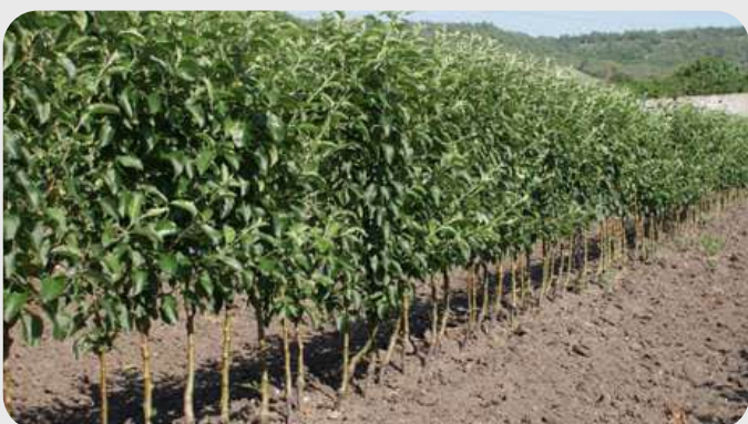
MYROBALAN ЎРИК ВА ОЛХЎРИ ПАЙВАНДТАГИ