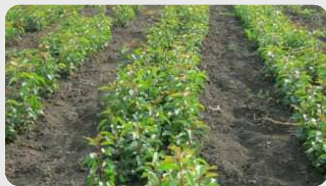
FOX 11 (ярим пакана) НОК ПАЙВАНДТАГИ