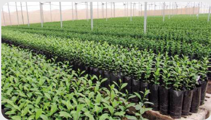
VSL-2 / KRYMSK 5 (ярим пакана) ГИЛОС ПАЙВАНДТАГИ