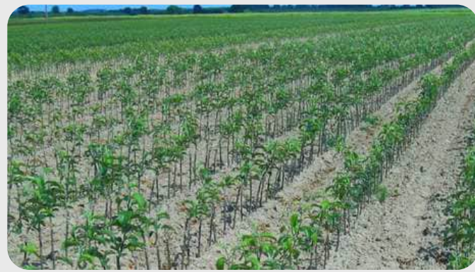
KONTROLLER ОЛХЎРИ, ШАФТОЛИ, БОДОМ, ЎРИК ПАЙВАНДТАГИ