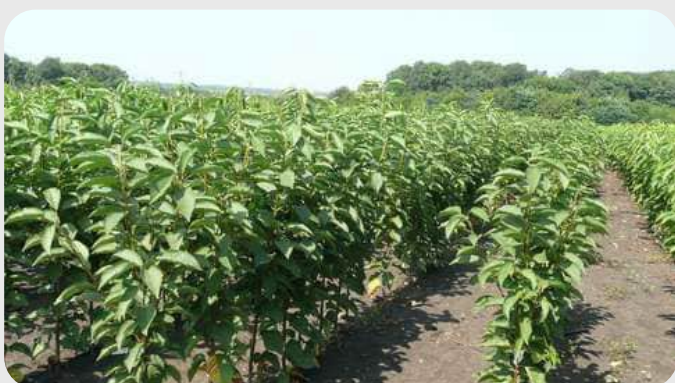
КАР-6 Р (ярим пакана) ГИЛОС ПАЙВАНДТАГИ