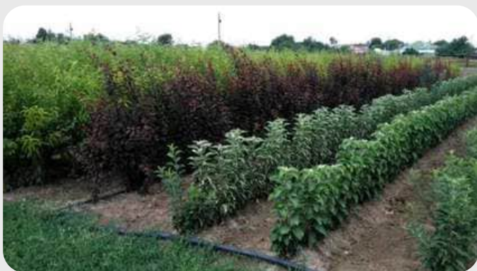
GF-677 ШАФТОЛИ ВА БОДОМ ПАЙВАНДТАГИ