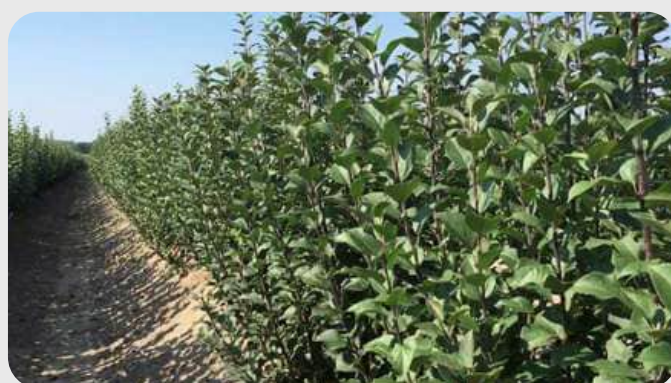
GARNEM БОДОМ, ШАФТОЛИ, НЕКТАРИ